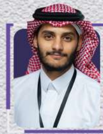
عمرو ماجد مصور فوتوجرافي