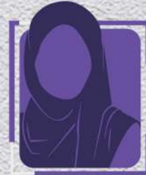
ريم سلمان الري الأمين العام